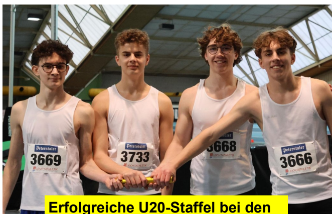
Erfolgreiche U20-Staffel bei den Hallenmeisterschaften