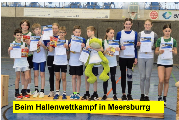
Beim Hallenwettkampf in Meersburg