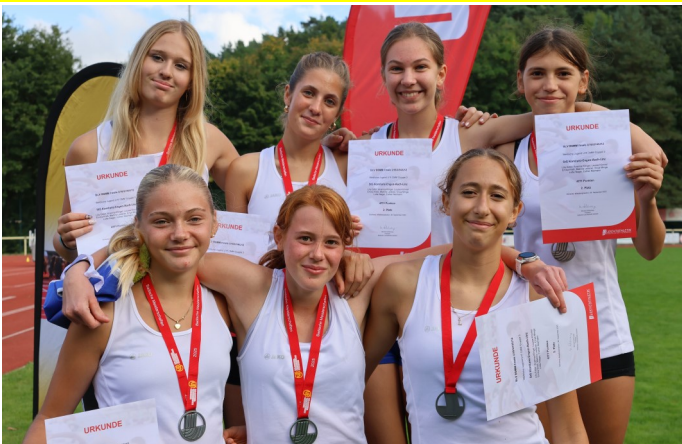
Die U16-Mädels erfolgreich in der Mannschaft zusammen mit Konstanz