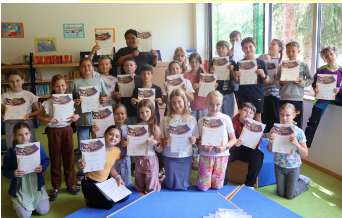
„Schau mal, was ich kann“ - Grundschule Engen