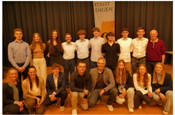
Erfolgreiche Sportler bei der Ehrung in Engen