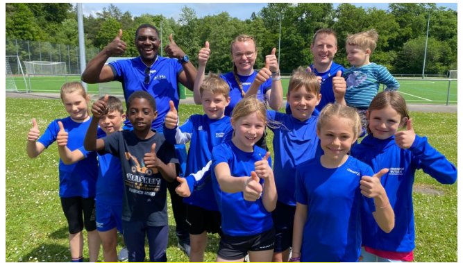
Die Gruppe U8 und U10

08.03. Bezirkssportlerehrung in Moos 13.03. Sportlerehrung in Engen 28.03.-03.04.: Trainingslager in Tenero 25./26.4.: Bahneröffnung und BW Stabi-Cup 1/3 mit offizieller Einweihungsfeier des Hegau-Stadions. 10.05.: Finale BW Stabi-Cup 3/3 mit Bezirksmeisterschaft 20./21.06. BLV Blockmehrkämpfe U14/U16