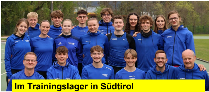
Im Trainingslager in Südtirol

Das traditionelle Trainingslager fand vom 18.04.-24.04.2025 in Brixen statt.