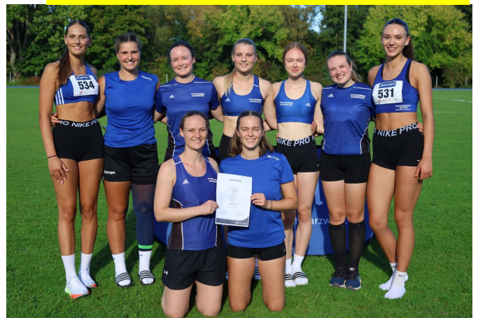
Wir sind stolz auf unser Frauenteam!