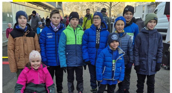
Die Teilnehmer am Tuttlinger Silvesterlauf