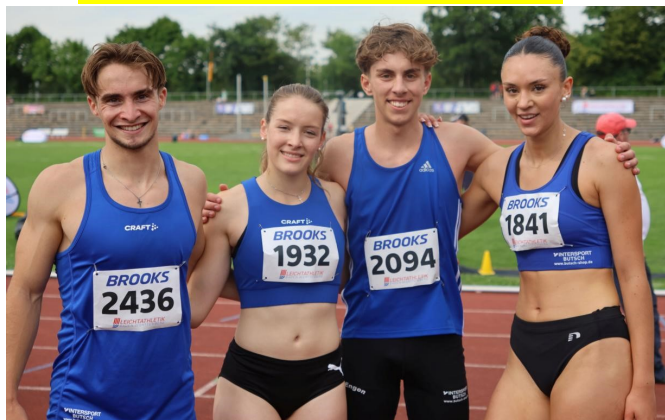
4x400m Mixed macht richtig Spaß