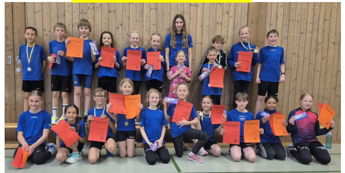
Erfolgreich bei der Kinderleichtathletik