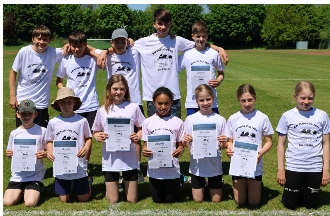
Die erfolgreichen Stabhochspringer der Nachwuchsgruppe beim BW Stabi-Cup 2025