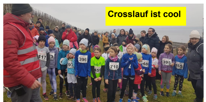
Crosslauf ist cool