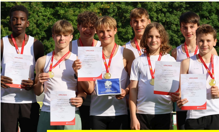
Die Jungs der U16 waren in der Mannschaft und in der Staffel Top in Baden