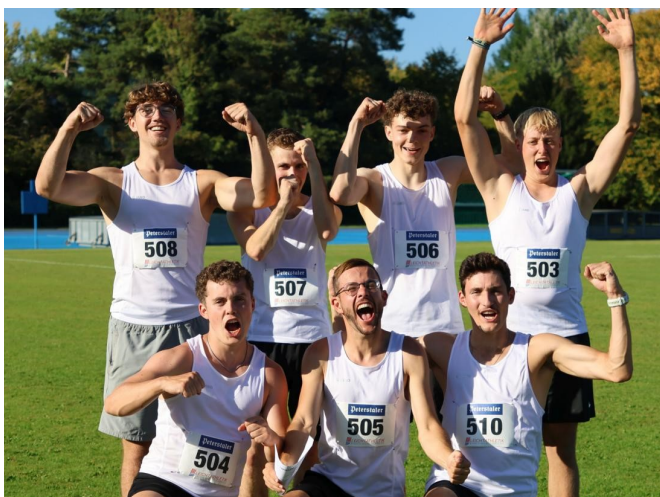
Das Team der Männer freut sich über tolle Leistungen bei den BW-Teams